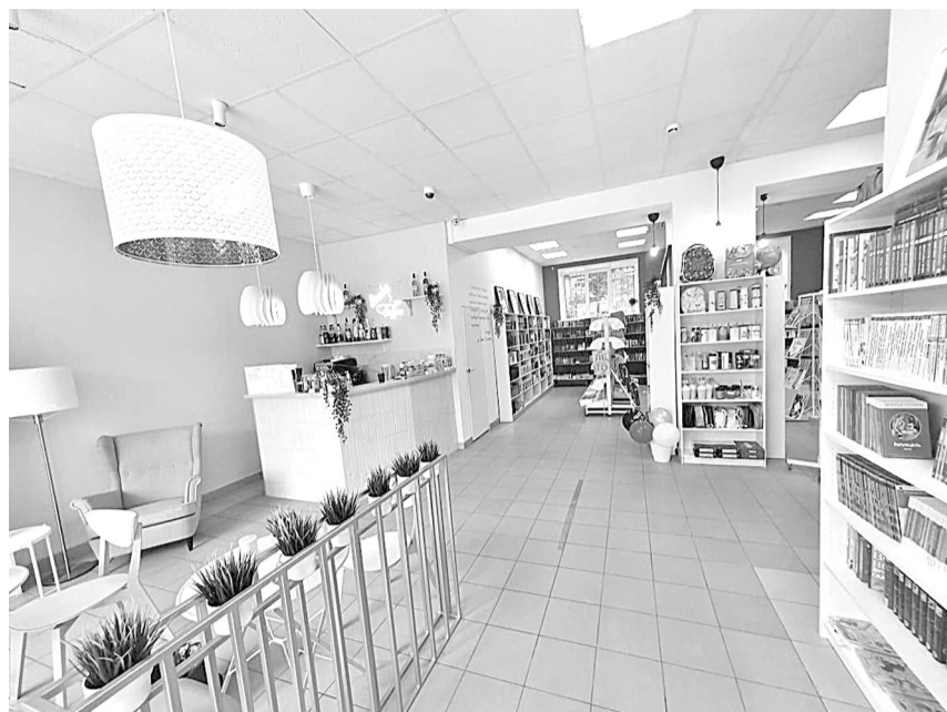
Обновленный интерьер магазина «Книжная лавка» на Подбельского, 47